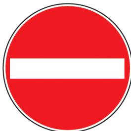
Verbot der Einfahrt / Einfahrt verboten

Ich darf in diese Straße nicht einfahren .