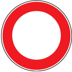
Verbot für Fahrzeuge aller Art

Ich darf diese Straße niemals durchfahren .