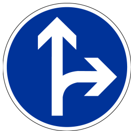
Vorgeschriebene Fahrtrichtung – geradeaus oder rechts

Ich darf nur geradeaus oder nach rechts fahren .