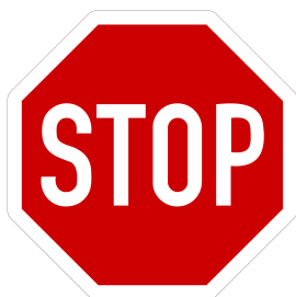
Halt! Vorfahrt gewähren!