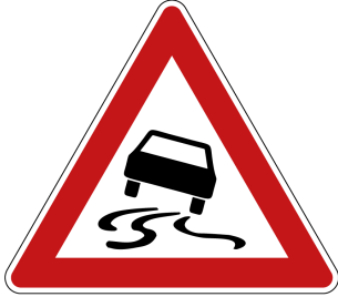
Schleudergefahr bei Nässe oder Schmutz

Ich kann bei Nässe oder Schmutz ins Schleudern geraten .