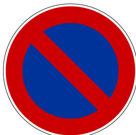
Eingeschränktes Halteverbot / Parkverbot